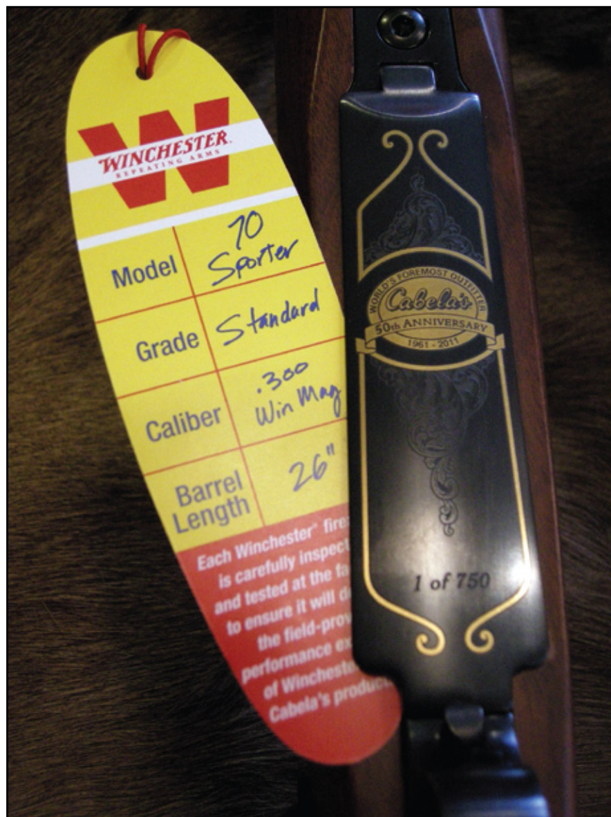
Винтовка модели 70 из серии, выпущенной к 50-летию фирмы Cabela's, показанная внизу, выпускается с гравированной крышкой магазина и копией оригинальной бирки 1961 г.

Для того чтобы отметить своё первое пятидесятилетие, торговая фирма заказала юбилейную серию винтовок.