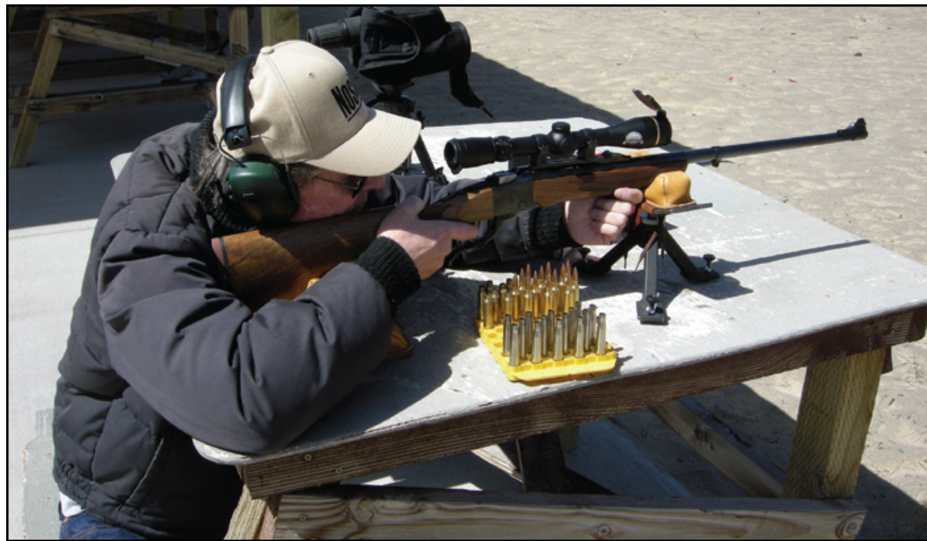
Специальная юбилейная модель Ruger No. 1, показанная внизу, изготовлена малой серией в штучной мастерской фирмы Ruger. Оснащенная оптическим прицелом Leupold юбилейной серии, во время тестирования на стрельбище постоянно показывала кучность на уровне угловой минуты.

ореха сделана со вкусом: цевье в стиле Александра Генри и приклад классической формы. Нарезка решетки, охватывающей периметр шейки, выполнена деликатно; на красный затылок-амортизатор нанесён логотип фирмы Ruger. Выполненный всецой золотом юбилейный логотип фирмы Cabela's был расположен на нижней поверхности ствольной коробки, прямо перед клиновым затвором. В продажу поступит только 500 штучных экземпляров винтовки Ruger No. 1.