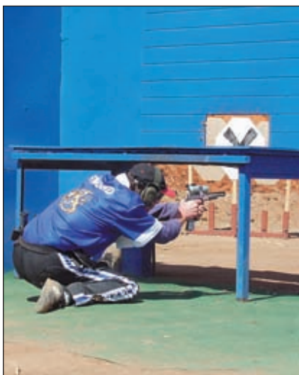
Позиции для стрельбы – самые неудобные. На упражнении № 25 «Сюрприз от шефа»

родоначальники этого замечательного вида спорта. Очень сильные команды представили Филиппины, ЮАР, Австралия. Но, в последнее время и Европа стала подтягиваться к лидерам и теснить фаворитов. Много хороших стрелков во Франции, Италии, Швеции, Норвегии, Чехии, Словении.