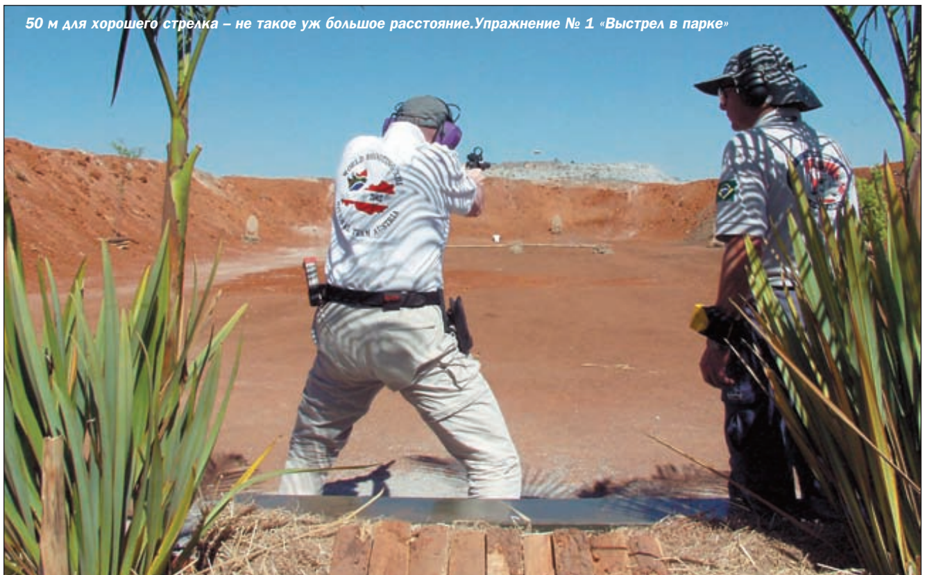
50 м для хорошего стрелка – не такое уж большое расстояние. Упражнение № 1 «Выстрел в парке»

Нужно сказать, что разнообразие технически сложных упражнений держало стрелков в постоянном напряжении. На матче были представлены 10 коротких