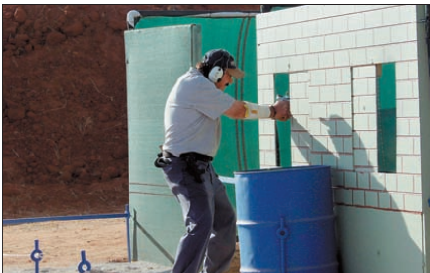
Дино Евангелинос, Президент Международной Ассоциации Судей по практической стрельбе, выполняет упражнение №8 «В этих стенах», стреляя с одной травмированной рукой