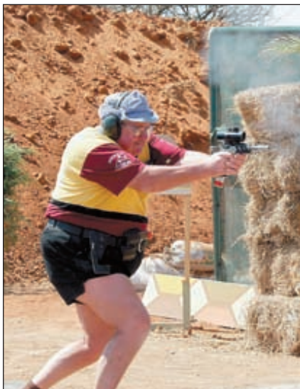
Практическую стрельбу любят все. Упражнение № 4 «Поразительный»