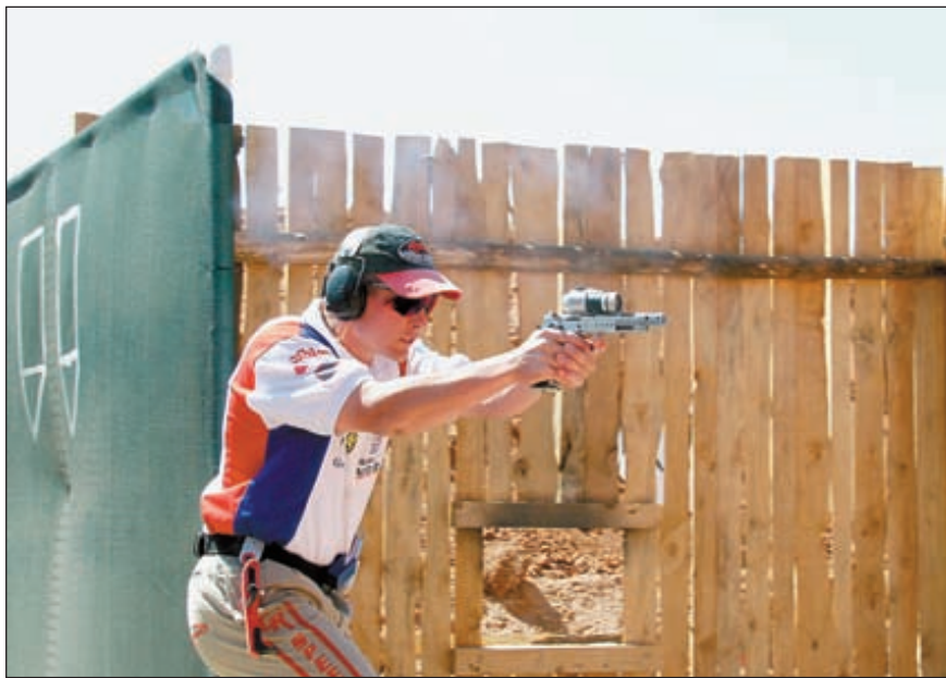
Открытая категория. Чемпион мира Эрик Граффел выполняет упражнение № 29 «Каняни»

ешь, тем лучше результат – бескомпромиссный таймер точно, до сотой доли секунды, показывает продолжительность стрельбы. Но если будешь стрелять быстрее, чем следует, то можешь промахнуться, и тогда штраф за промах «съест» всё преимущество скорости.