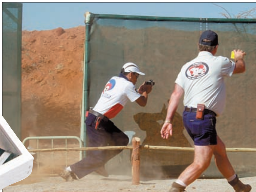
Стремительное перемещение – необходимое условие победы не только на Упражнении № 3 «Быстрый Эдди»