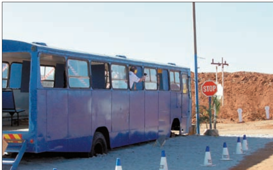
Вести огонь из «переполненного пассажирами» автобуса – непростое дело. Упражнение №20 «Последний автобус к славе»