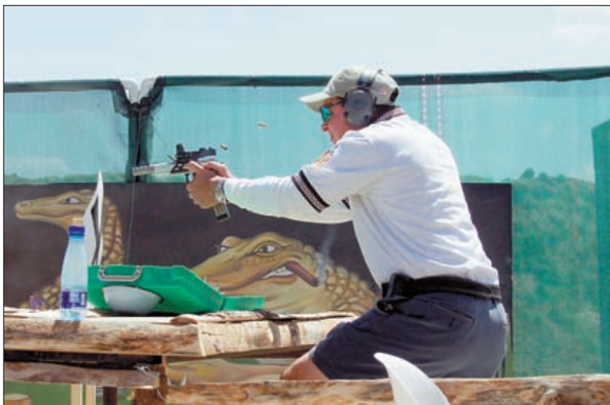
Скоростная стрельба нужна при условии попадания. Упражнение № 12 «Улыбнитесь»