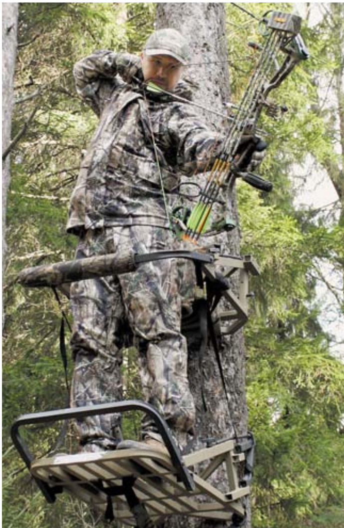
Специальная платформа, закрепляющаяся на нужном расстоянии от земли

бывает от 2 и до 7 (больше я пока ещё не видела). Каждая из мушек пристреливается на определённое расстояние. Например, 10, 20, 30 м. и т. д. Наиболее удобным расстоянием для прицеливания большинство охотников называют дистанцию в 20 м.