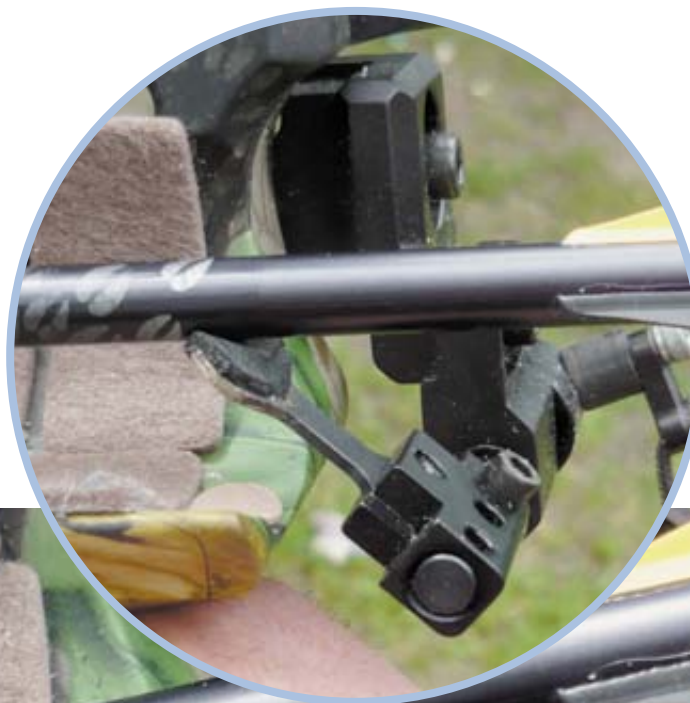
Падающая полочка до момента растяжения и после