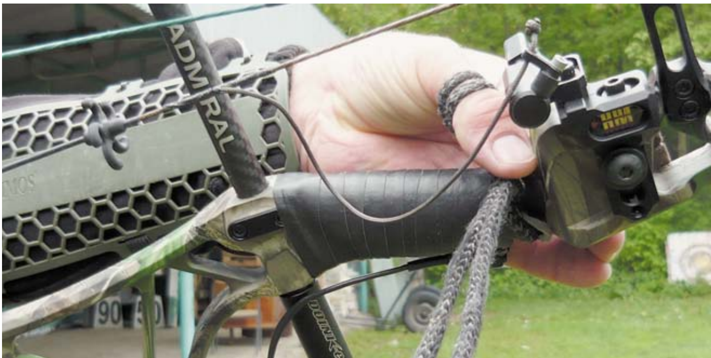
Вязочка позволяет не выпасть луку из руки после выстрела

Чтобы лук после выстрела не упал на землю с вашей вышки, на руку надевается специальный кожаный ремешок, называющийся «слинг». Хотя своим охотникам я всё-таки советую использовать вязочку из обычного хлопчатобумажного шнурка. Так как психологически человек, стреляющий со слингом, всё равно будет подхватывать лук, что, напомним, чревато вылетами стрелы вверх от нужной нам цели. Вязочка же расположена на пальцах и никак не позволит луку выпасть.