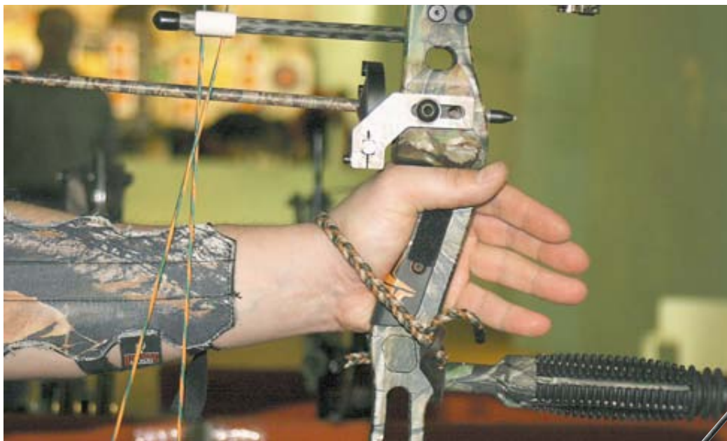
Некоторые охотники используют слинг вместо вязочки