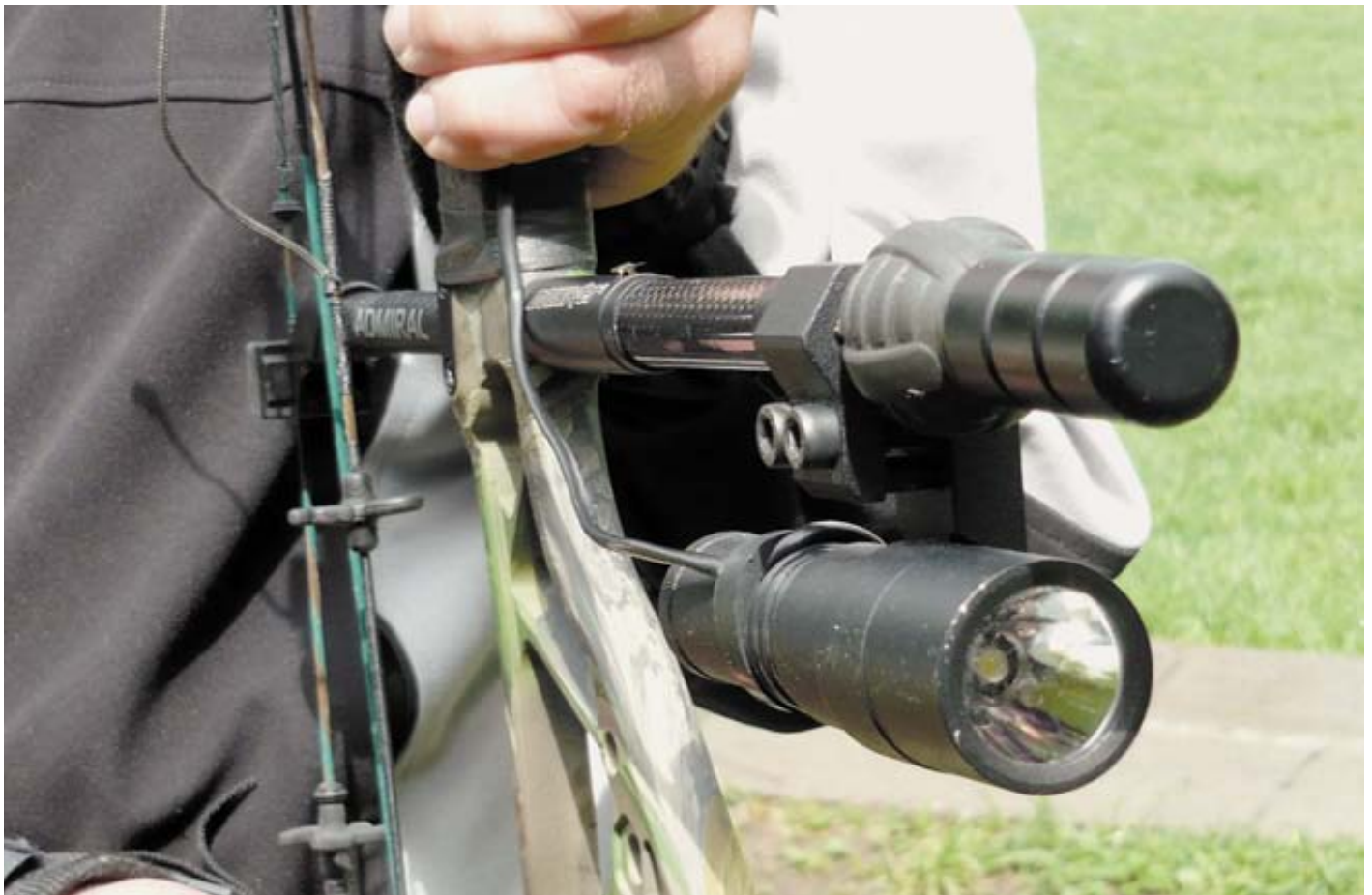
Охотничий стабилизатор с прикрепленной подсветкой для стрельбы в темное время суток