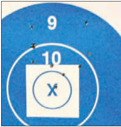
Рекордная мишень с результатом 13,5 см (дистанция 1000 ярдов). Выстрел в X был последним, серьёзно расширившим очень неплохую группу