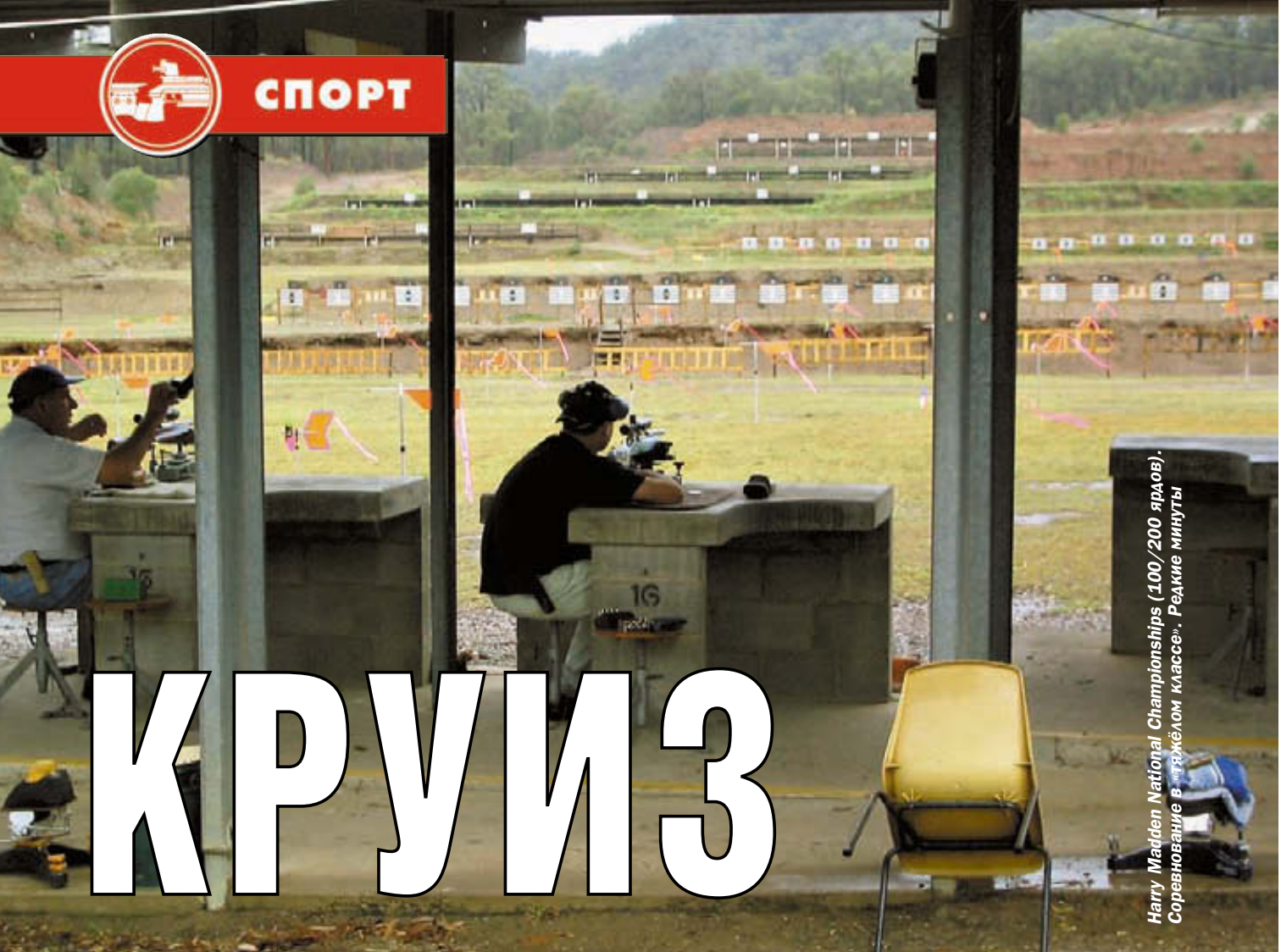
Harry Madden National Championships (100/200 ярдов). Соревнование в «тяжёлом классе». Редкие минуты