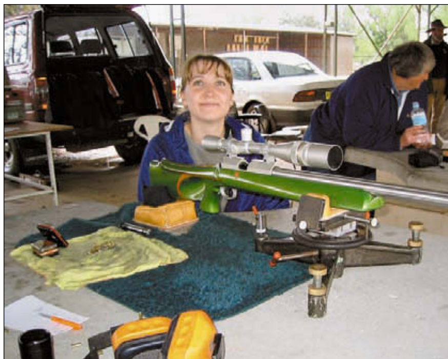
Девушка-новичок с тяжёлой бенчрестовской «мелкашкой». Женщины в бенчресте всегда играли не последнюю роль