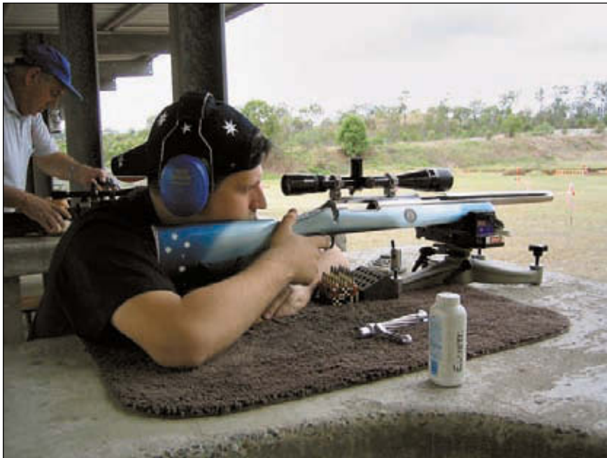
Harry Madden National Championships (100/200 ярдов). Вот-вот будет дана команда «Огонь!». А пока – изучение ветра

заний является то, что победитель один (по сумме кучности в двух винтовках и двух дистанциях), а призовых мест 10 для каждой дистанции и 10 в абсолюте.