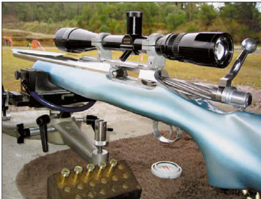
Лёгкая бенчрестовская винтовка – само совершенство

Первым испытанием и, как оказалось потом, самым сложным, стал для меня второй по значению ежегодный чемпионат (после национального), проводившийся в честь основателя австралийского бенчреста Гарри Мэддена. Конкуренция сильнейшая. 36 участников, из которых пара десятков может претендовать на победу. Стрельба ведётся на кучность. 5 матчей в каждом классе («тяжёлая винтовка» и «лёгкая винтовка») на каждой дистанции 100 и 200 ярдов по 5 зачётных выстрелов. То есть всего 4 отдельных соревнования. Особенностью состоя-