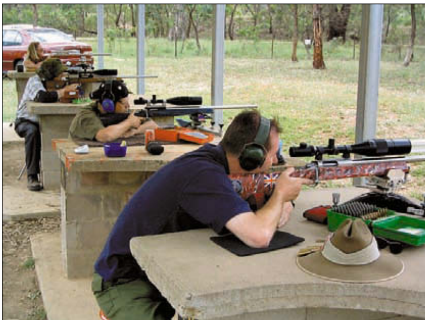
Класс «лёгкая винтовка». Здесь лучшая группа из 5-ти пробойн была равна рекордной группе по 10-ти выстрелам

День соревнований открылся благоприятной погодой. Дул лёгкий утренний ветерок, когда начался первый матч в «тяжёлом классе» – мой первый официальный матч на 1000 ярдов. После пристрелки была поднята зачётная мишень и дано десять минут для производства десяти зачётных выстрелов. После окончания матча мишени были помечены и подняты на обозрение. Я видел, что группа небольшая, но понятия не имел, какая она должна быть, чтобы быть конкурентоспособной. Вдруг сзади я услышал разго-