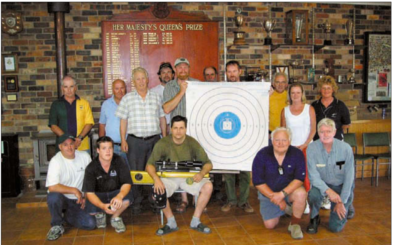
Бенчрест – это большая дружная семья и всегда много новых друзей. Новый Национальный рекорд Австралии теперь принадлежит простому русскому пареньку. И это приятно!

P.S. Полные результаты соревнований, а также фотографии со всех 5 чемпионатов вы можете посмотреть, посетив официальный сайт Национальной ассоциации Бенчреста: www.benchrest.ru