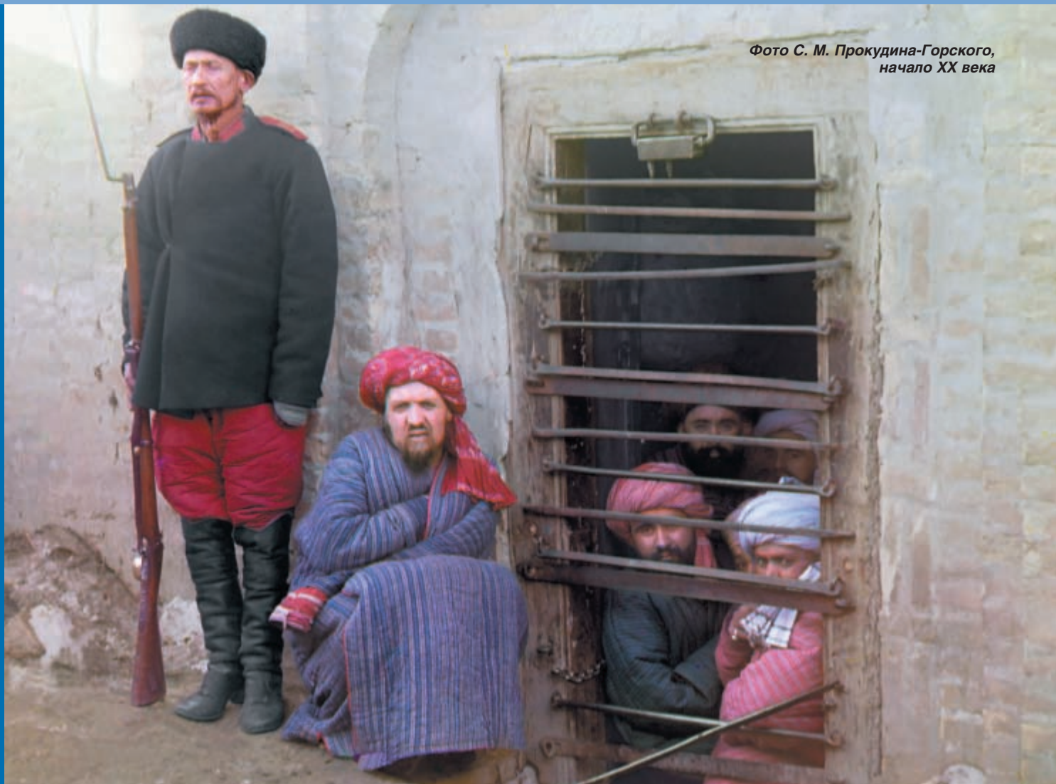
Фото С. М. Прокудина-Горского, начало XX века