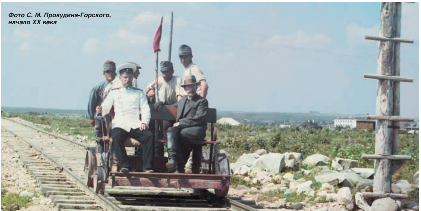
Фото С. М. Прокудина-Горского, начало XX века

когда лица, следующие в пределах пограничной полосы с товарами или ношами или по пограничной реке на нагруженных судах, либо переходящая границу незаконными путями и способами, после двухкратнаго оклика «стой» и предупредительнаго выстрела вверх, не остановятся и обнаружат намерение скрыться от преследования и не окажется возможным настичь и задержать их и когда задержанныя лица обнаружат попытку к бегству и не окажется возможным настичь их».