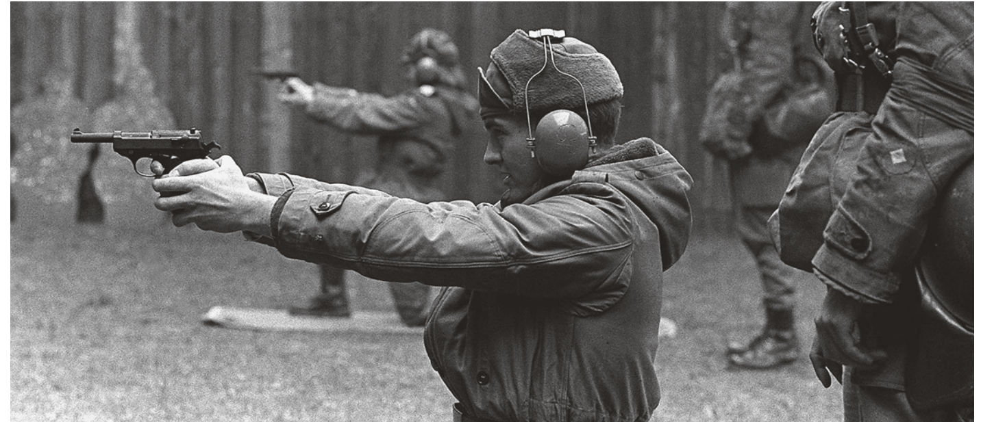
Стрельба из оружия времён Второй мировой войны – один из элементов «обязательной программы» для гостей бундсвера. На снимке: американские солдаты во время ознакомительной стрельбы из пистолета P38.

Поэтому окраска щёчек у разных производителей пистолета P38 может быть разной, но чаще всего встречаются глянцевые бакелитовые щёчки коричневого цвета с жёлтыми вкраплениями. Восстанавливать производство данной разновидности бакелита по стоимостным и технологическим причинам было крайне нецелесообразно, поэтому все усилия разработчиков ножа были направлены на поиски современного материала, который мог бы выступить заменителем бакелита. В конце концов они увенчались успехом, причём пластмасса-заменитель не только соответствует оригинальному материалу внешне, но и очень сходна с ним на ощупь и также приятно лежит в руке. В отличие от PP модель P38 имеет петлю для крепления темляка, опять-таки выполненную очень схоже с петлей на пистолетной рукоятке под ремешок кобуры.