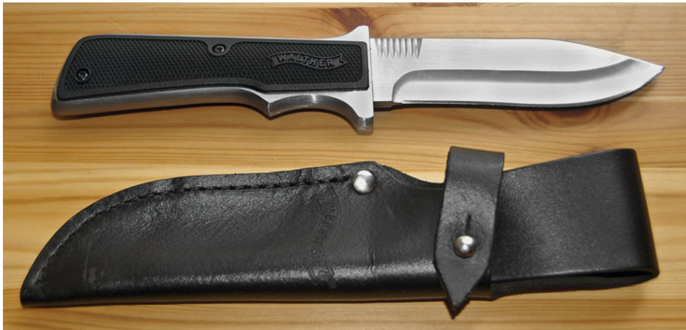
Walther PP отличается от модели P38 накладками рукоятки и более коротким и широким клинком, а также исполнением ножен