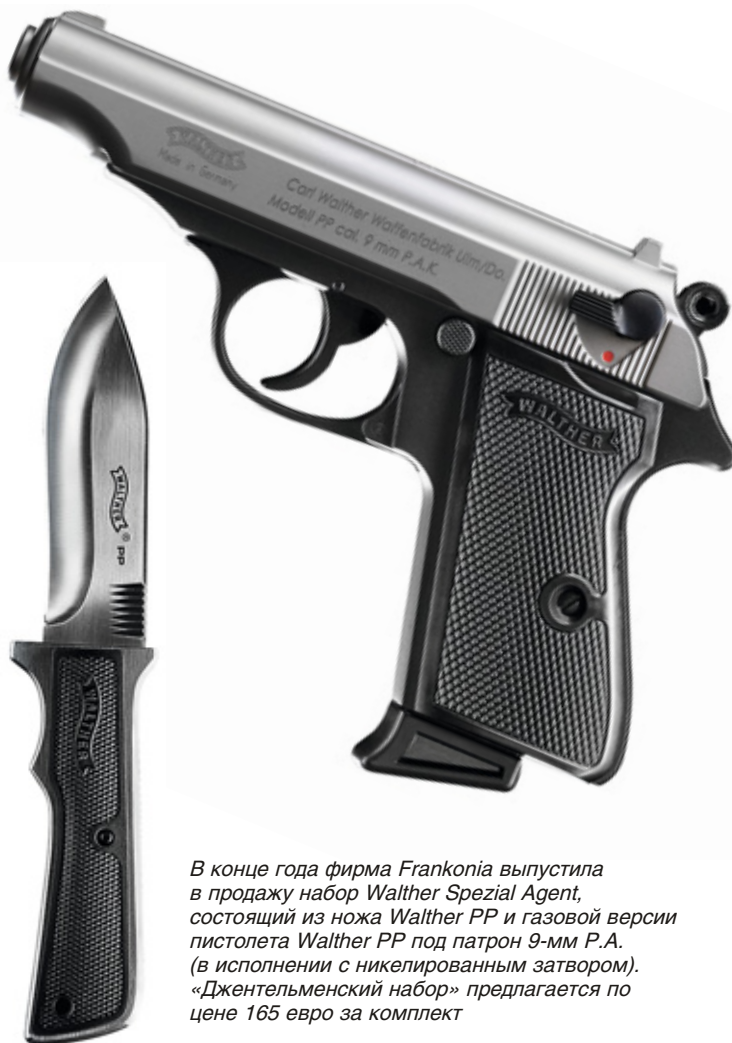
В конце года фирма Frankonia выпустила в продажу набор Walther Spezial Agent, состоящий из ножа Walther PP и газовой версии пистолета Walther PP под патрон 9-мм P.A. (в исполнении с никелированным затвором). «Джентельменский набор» предлагается по цене 165 евро за комплект

охотников и туристов, а также коллекционеров, которым бы хотелось бы иметь что-либо необычное. Невысокая стоимость (сейчас немецкие производители предлагают Walther PP и P38 по цене от 40 евро за штуку) делает их необычайно привлекательными с точки зрения соотношения «цена/качество». В то же время и P38, и PP трудно отнести к шедеврам ножевого дизайна, да и вряд ли его авторы ставили такую задачу. Приоритетами для дизайнеров ножей «Вальтер» являлись, прежде всего, практичность и запоминающийся внешний вид в духе «ретро». Характерная «тевтонская» внешность была достигнута за счёт заимствования ряда конструктивных элементов и оформления у «пистолетов-тёзок», благодаря чему указанные продукты прочно ассоциируются с эпохой 30–50-х гг. прошлого столетия. Особенно следует выделить удачный подбор материала для рукоятки P38, имитирующей ставшую сегодня уже культовой пластмассу – легендарный бакелит.