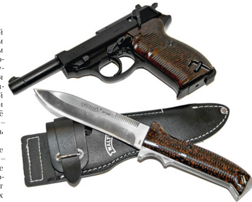
Нож Walther P38 с ножами и пневматическая реплика пистолета Walther P.38 фирмы Umarex

Выпускаемый сегодня вариант пистолета (его продолжает изготавливать в США по лицензии фирма Smith & Wesson) носит название Walther PPK/S и представляет собой комбинацию моделей PP и РРК. Эта модель имеет стальные кожух и рамку светлого цвета и чёрные пластиковые щёчки рукоятки. Точно такое же сочетание цветов было выбрано и для ножа PP – клинок и его хвостовик выполнены из светлой хромо-молибденовой стали, а накладки щёчки имеют точно такие же цвет и рифление, как и у пистолета.