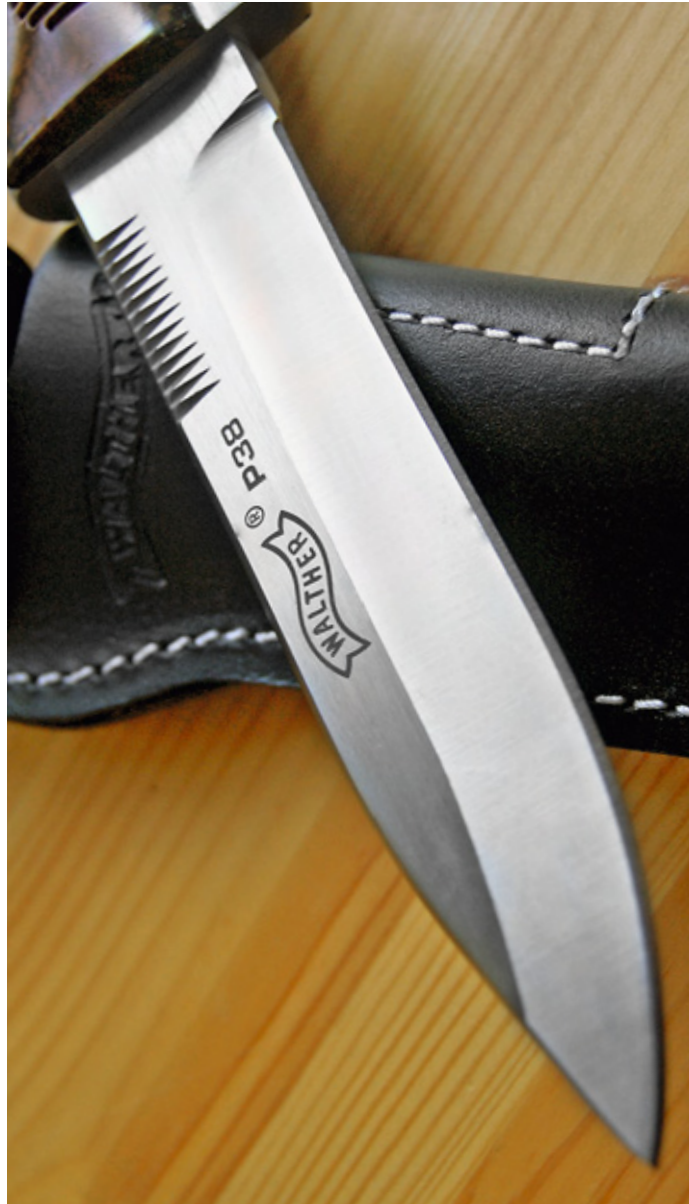
Клинки ножей изготовлены из относительно недорогой, но качественной нержавеющей стали марки 440С

с сетчатым рифлением типа «рыбья чешуя», как уже указывалось, стилизованные под накладки рукоятки пистолета Walther PP. Они крепятся к рукоятки при помощи двух винтов. На накладках имеется логотип фирмы Carl Walther, логотип вместе с обозначением материала и модели также наносится на одну из сторон клинка.