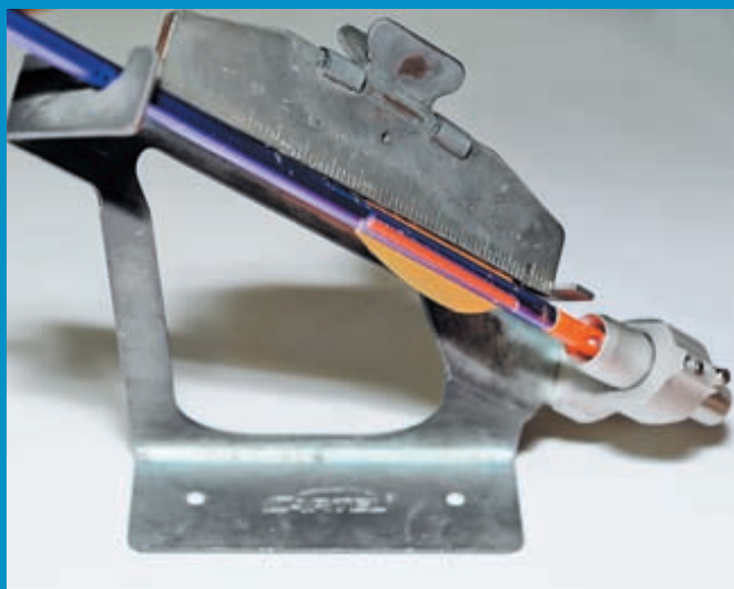
После нанесения клея и ровного его распределения по основанию пера плотно прижмите проклеенную часть к трубке стрелы так, чтобы зажим примагнитился к пероклейке

нанесения клея и его ровного распределения по основанию пера, плотно прижмите проклеенную часть к трубке стрелы так, чтобы зажим примагнитился к пероклейке. Ждём 3 минуты.