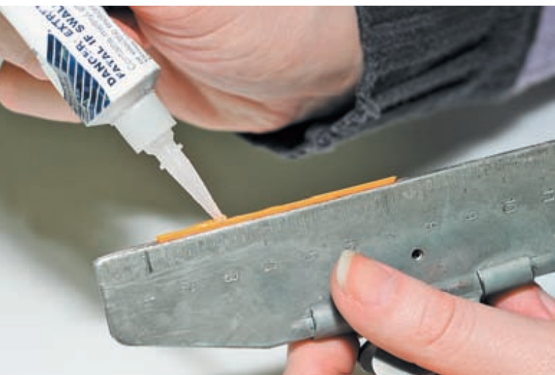
Равномерно распределяем клей по основанию перышка