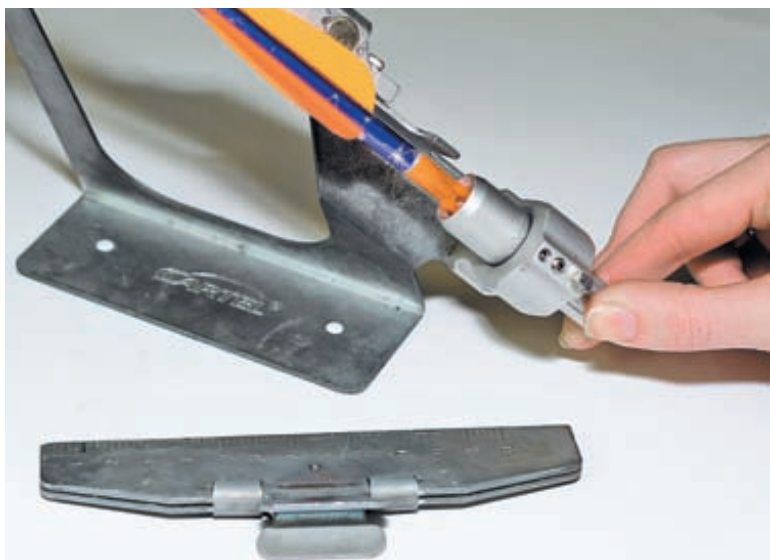
Для поклейки следующего пёрышка достаточно просто повернуть на пероклейке выступ для хвостовика стрелы по часовой стрелке до щелчка