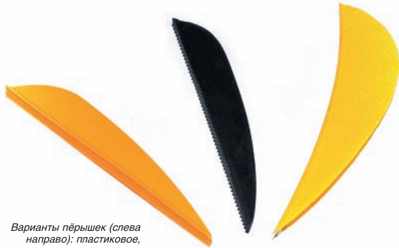
Варианты пёрышек (слева направо): пластиковое, резиновое, «индюшка»