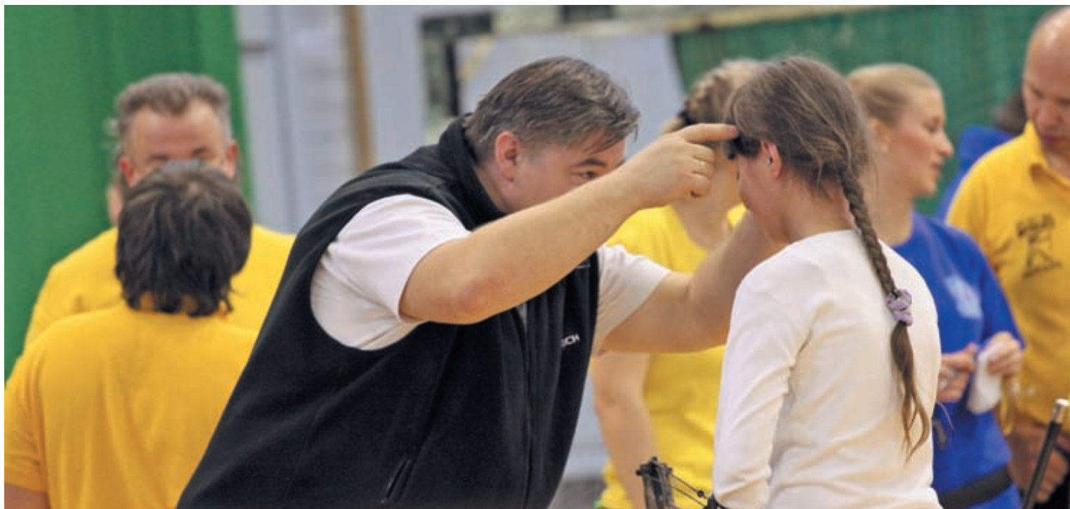
Еще один плюс стрельбы из лука – это невероятная психологическая подготовка

Поэтому отметим ещё один плюс стрельбы из лука – это невероятная психологическая подготовка. Уже после года занятий в секции стрельбы из лука ребенок становится более собранным, решительным и внимательным. Вы представьте себе, какую дисциплину и порядок должен привить тренер, чтобы все строго соблюдали технику безопасности поведения во время стрельбы и нахождения на стрельбище. Или вот вам ситуация из жизни. Чемпионат мира или любые другие соревнования. Пусть