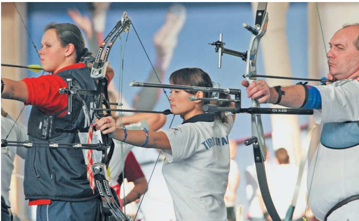
На соревнованиях надо максимально контролировать себя – каждое твоё неверное движение может отразиться на выпущенной стреле