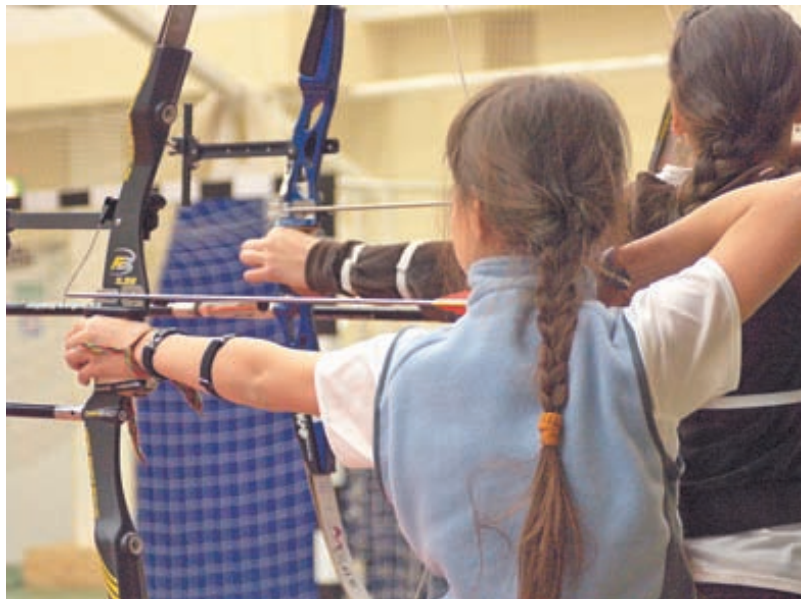
Натяжение лука и его удержание происходит за счёт групп мышц правой лопатки, широчайших мышц спины и косых мышц живота

Именно поэтому тренеры дают постепенно увеличивающееся количество упражнений на отжимания и качание прессы. Раскрою секрет – они не тираны, как кажется поначалу. Они просто знают, что именно понадобится в вашем развитии для того, чтобы в будущем вы стали