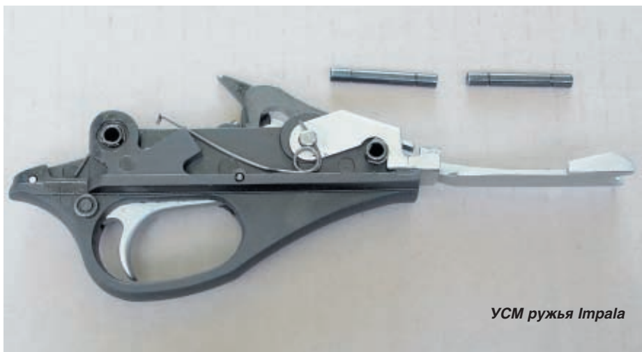
УСМ ружья Impala

В преамбуле настоящей статьи я упоминал две различные ценовые границы для отечественных и импортных