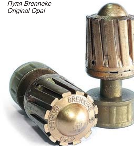
Пуля Brenneke Original Opal