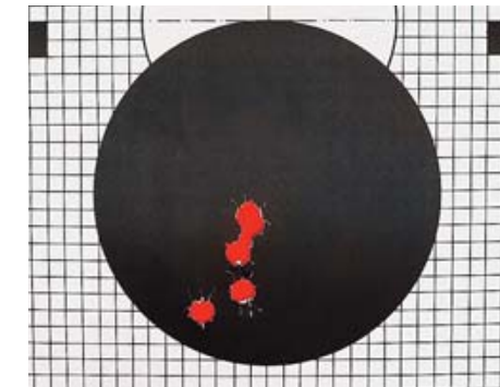
Результаты стрельбы патронами 12/70 из ружья с патронником 12/89