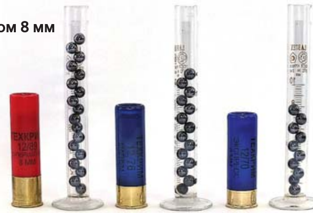
Сравнение картельных патронов 12-го калибра с различной длиной гильзы

осыпи, а для патронов с картелью – поперечник рассеивания элементов при учёте их общего количества. Во всех случаях при неизменной резкости равномерность (количество пораженных долей мишени) увеличивается с увеличением длины гильзы (массы снаряда). А для патронов с картелью увеличивается площадь поражённой области, при неизменной плотности поражения.