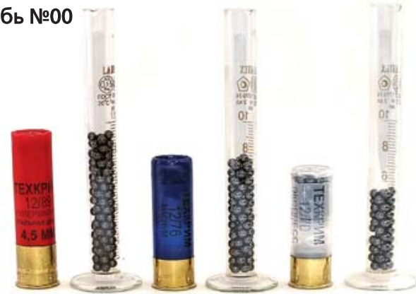
Сравнение дробовых патронов 12-го калибра с различной длиной гильзы.

Несмотря на меньшую кучность, в патронах со стальной дробью есть большой плюс: периферийные дробины не деформируются, а, следовательно, имеют такую же резкость, как и центральные, что подтверждается на практике, при этом эффективная дальность стрельбы такими патронами в 1,5 раза меньше. Патрон со стальной дробью более эффективен при стрельбе в зарослях, когда более или менее прицельный выстрел классическим патроном со свинцовой дробью сделать проблематично.