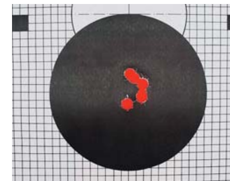
Результаты стрельбы патронами 12/70 из ружья с патронником 12/70

Стрельба пулевым патроном калибра 12/70 из патронника 12/89 возможна, более того, это никак не сказывается на качестве выстрела.