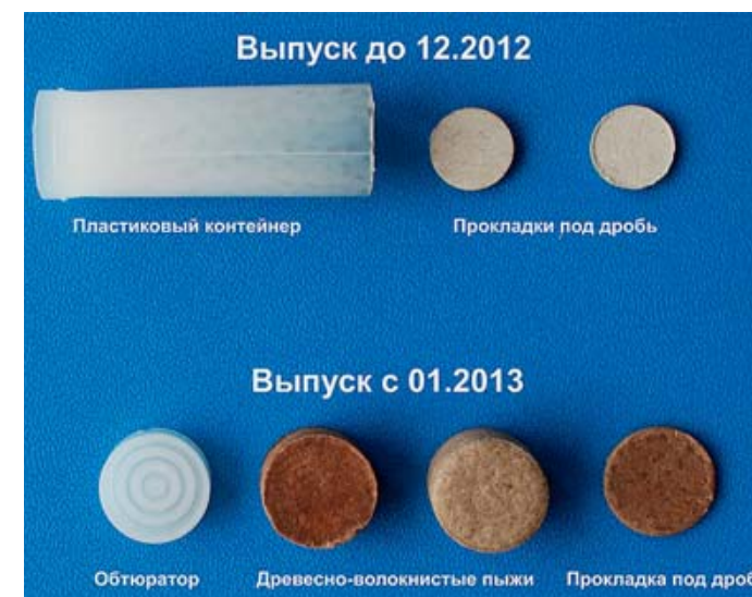
Элементы конструкции сравниваемых патронов