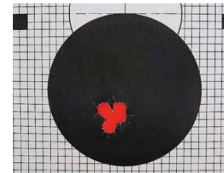
Результаты стрельбы пулей Orinal Opal