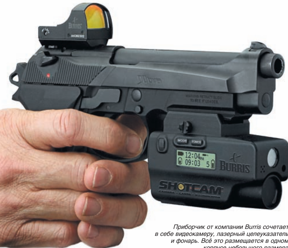
Приборчик от компании Burris сочетает в себе видеокамеру, лазерный целеуказатель и фонарь. Всё это размещается в одном корпусе небольшого размера

в конструкции деталей, изготовленных из полимерных материалов, и, наконец, компактная версия пистолета Storm от Beretta. Всё указывает на возросшую конкуренцию между производителями малогабаритных пистолетов и расширение этого сектора оружейного рынка.