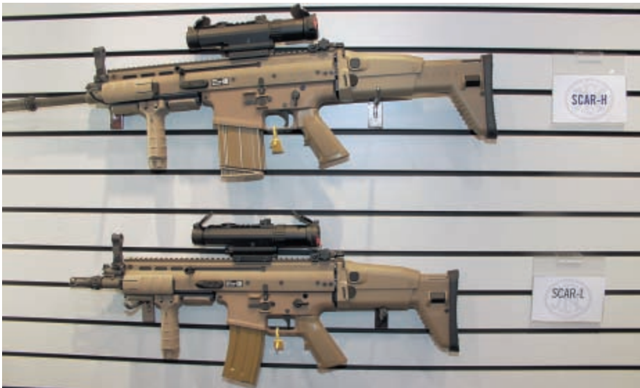
Штурмовые винтовки FN Scar L и Scar H в прошлом году были выбраны корпусом морской пехоты США. Это первоклассное оружие, безусловно, скоро примет участие в тендерах и в Старом свете

На Shot Show всегда, в большей или меньшей степени, год за годом чередуются успехи длинноствольного и короткоствольного оружия. В прошлом году такие гиганты как Remington, Browning, Winchester, даже без учёта более мелких Smith & Wesson, Marlin и Weatherby, выпустили целые грузовики новых моделей нарезного и гладкоствольного оружия.