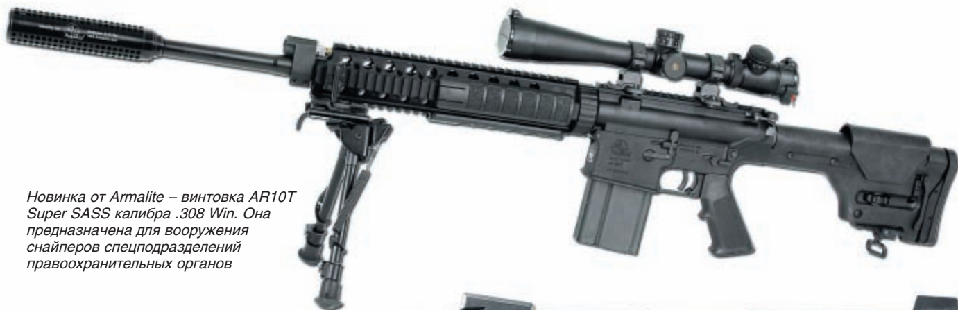
Новинка от Armalite – винтовка AR10T Super SASS калибра .308 Win. Она предназначена для вооружения снайперов спецподразделений правоохранительных органов

должна была спасти Citygroup, крупнейший банк, занимающийся ипотечным кредитованием в США, купив 5 % его активов за $ 135 млн.