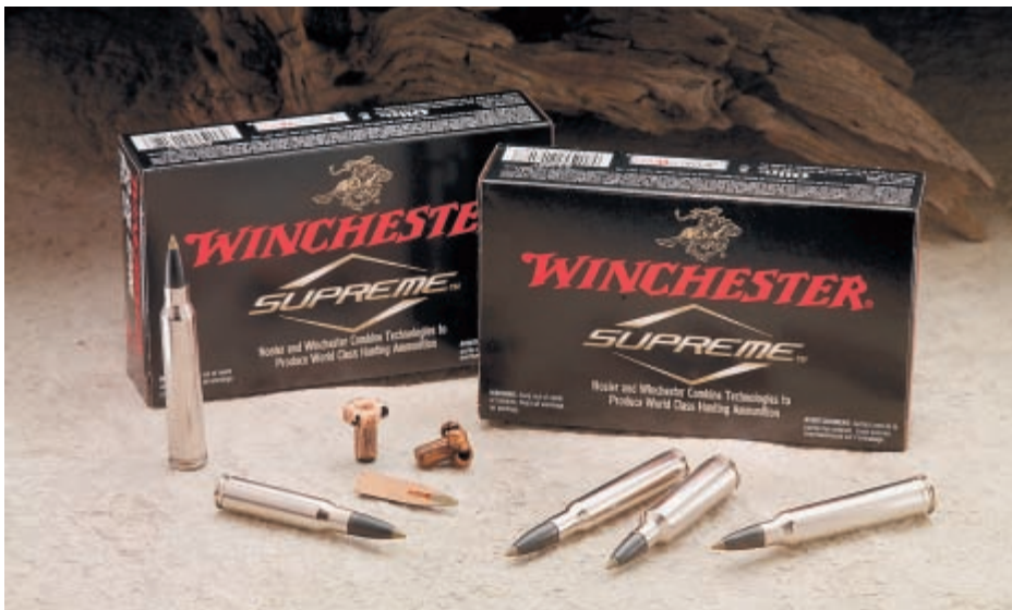
Результатом совместных усилий Winchester и Nosler стало появление качественного боеприпаса – охотничьего патрона с никелированной гильзой и бессвинцовой пулей E-Tip

Заинтересовала новая линия штурмовых винтовок Carbon 15 Bushmaster, в основу которых положена AR15. В их конструкции широко использованы композитные материалы. Тем временем производители автоматических штурмовых винтовок и пистолетов-пулеметов готовятся встретить появление на рынке образцов с новой системой, уменьшающей подбрасывание оружия при стрельбе. Она разработана компанией TDI (Transformational Defence Industries), контролируемой швейцарской компанией Gamma. Принцип действия системы заключается в следующем: во время движения затвора назад его продольное перемещение при помощи копира преобразуется в вертикальное перемещение массивного балансира. Это позволяет кардинально уменьшить колебания оружия, особенно при автоматической стрельбе, и, в частности, заметно снижает подброс дульной части.