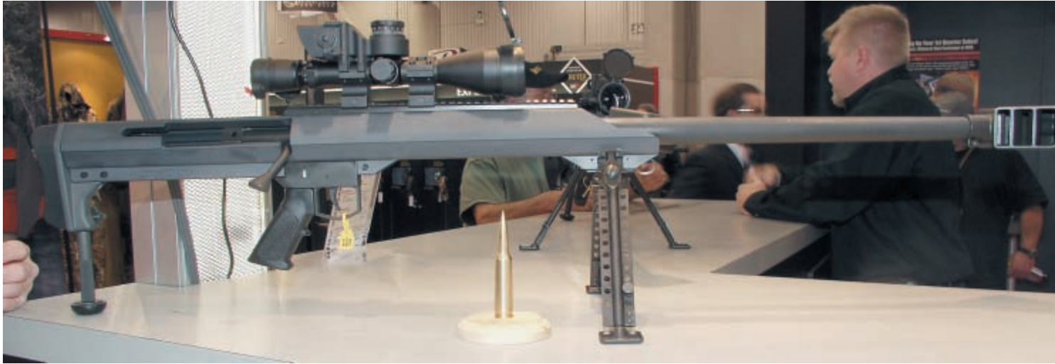
Barrett – единственная в мире компания, сконструировавшая самозарядную винтовку под патрон .50 BMG, в этом году показала новый образец. Теперь знаменитая модель 99 (на фото) изначально спроектированная под патрон .50 BMG, благодаря законодательным ограничениям, принятым в Калифорнии, переделана под патрон .416 Barrett который получен переобжимом патрона калибра .50 до калибра .416. Пуля массой 400 гран разгоняется до скорости свыше 3000 футов в секунду