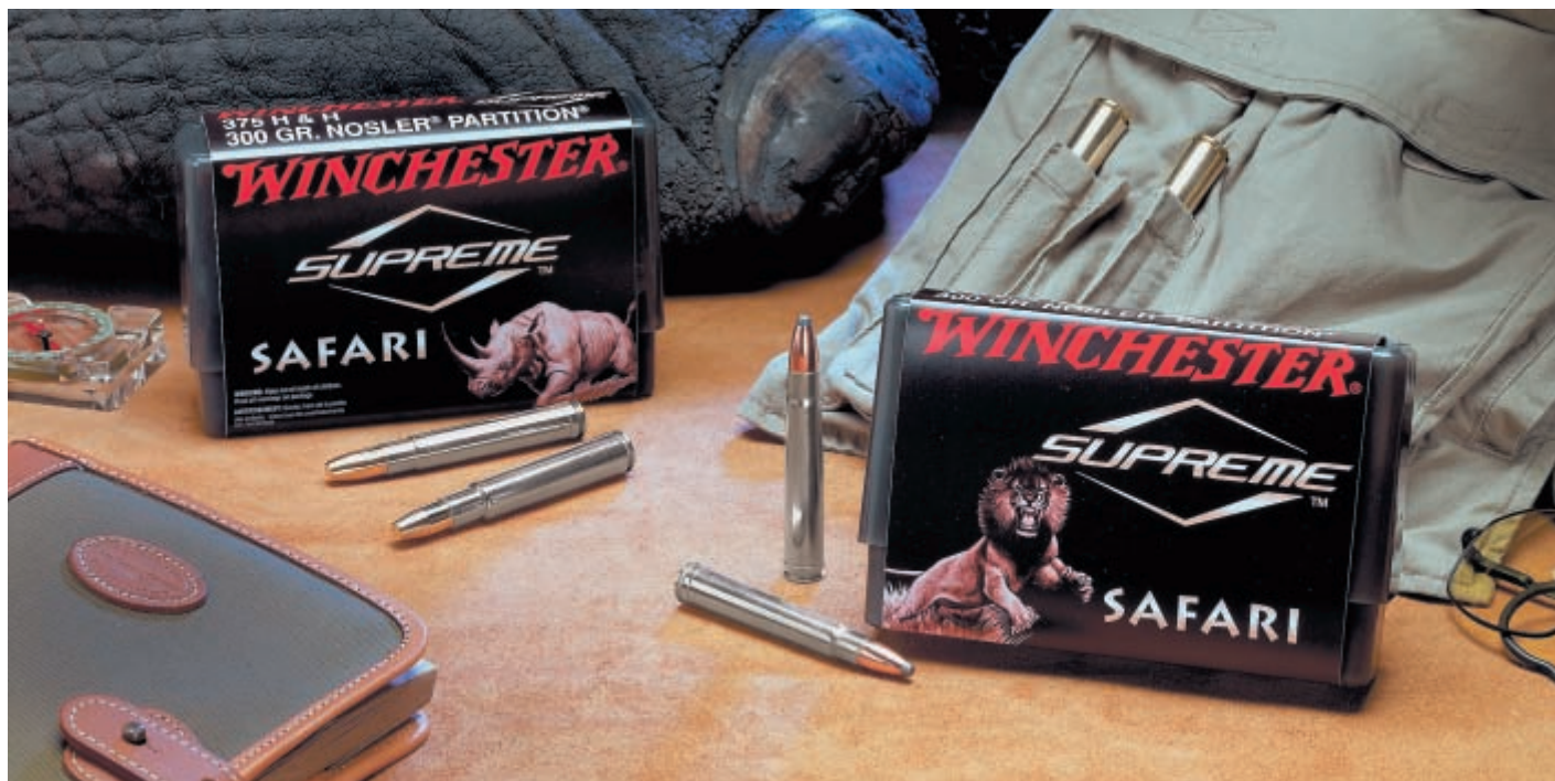
В этом году на выставке Winchester представил боеприпасы трех величайших классических африканских калибров .375 H&H, .416 Rigby и .458 Winchester Magnum. Все патроны снаряжаются пулями Nosler Partition и Nosler Solid с массами пуль в диапазоне 300, 400 и 500 гран соответственно

На Shot Show 2008 мы почти не увидели новинок этих компаний в области длинноствольного оружия. Очевидно, что сейчас они сконцентрированы на попытках закрепить свои достижения прошлого года на этом секторе рынка. Поэтому на выставке 2008 года солировали, скорее, пистолеты.