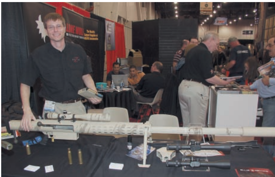
Формально остающаяся в ранге малого калибра 20-мм противотанковая пушка Vulkan. В зависимости от требований заказчика она может иметь вес от 25 до 60 кг. В принципе её можно назвать и противотанковым ружьём, поскольку она управляется одним человеком. Эффективная дальность стрельбы до 8 км