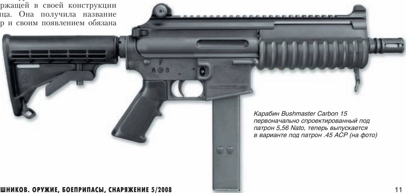
Карабин Bushmaster Carbon 15 первоначально спроектированный под патрон 5,56 Nato, теперь выпускается в варианте под патрон .45 ACP (на фото)

Говоря о боеприпасах, представленных на выставке, мы не можем не отметить новый тип пули для нарезного оружия компании Nosler не содержащей в своей конструкции свинца. Она получила название E-Tip и своим появлением обязана