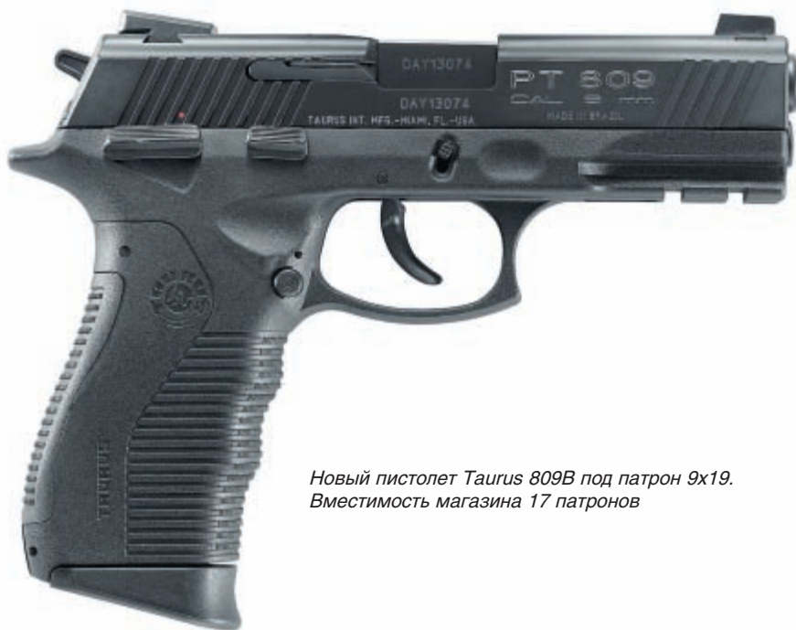
Новый пистолет Taurus 809B под патрон 9x19. Вместимость магазина 17 патронов