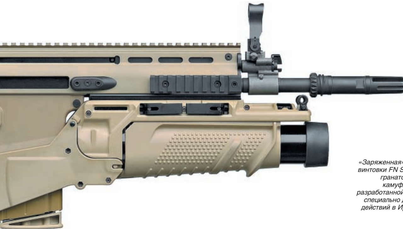
«Заряженная» версия штурмовой винтовки FN Scar с подствольным гранатомётом и пустынной камуфляжной раскраской, разработанной компанией FN-Usa специально для ведения боевых действий в Ираке и Афганистане

Хорошо идут дела и у Taurus, которая после запуска в прошлом году пистолета 24/7 OSS Ussocom, в этом представила новую серию пистолетов серии 800. Это