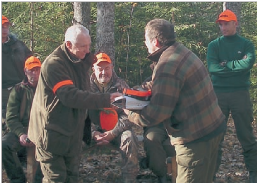
Автор статьи специализировался на косулях и также получал поздравления

Поэтому в среде шведских охотников всякий разговор о лосе, как об объекте охоты, без его возрастной дифференциации теряет смысл, ибо селективная добыча не оставляет места абстрактному понятию лося вообще. С этим мы столкнулись за три дня охоты несколько десятков раз – при инструктировании перед каждым загоном, во время самой охоты и при подведении итогов после неё. Первичная установка руководителя охоты была такова: с треляем о лосе с рогами (быка) с рогами в день или три таких лося за три дня охоты. При этом нельзя стрелять быков с тремя и четырьмя отростками, меньше и больше – можно. В отношении лани – не более одного крупного рогача в день, не более 3-х за охоту. Некоторые ограничения имелись также по косуле и по кабану, кроме лисицы, что незначительно усложняло процесс охоты, особенно для приезжих участников с небольшой практикой зверовых охот. Приведу один пример.