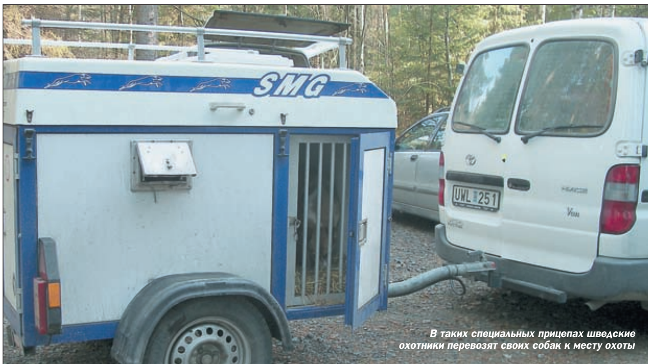
В таких специальных прицепах шведские охотники перевозят своих собак к месту охоты

Но какое это было занятие! Ружья, пистолеты и карабины рядами свободно стояли на полках маленького оружейного зала, их можно было брать в руки (без спроса и предъявления каких-либо документов (!)), рассматривать, открывать–закрывать, вскидываться, словом, prod еловать всё то, что в первую очередь и интересует охотника а или просто любителя оружия. Наряду с новыми образцами, целую сторону этого