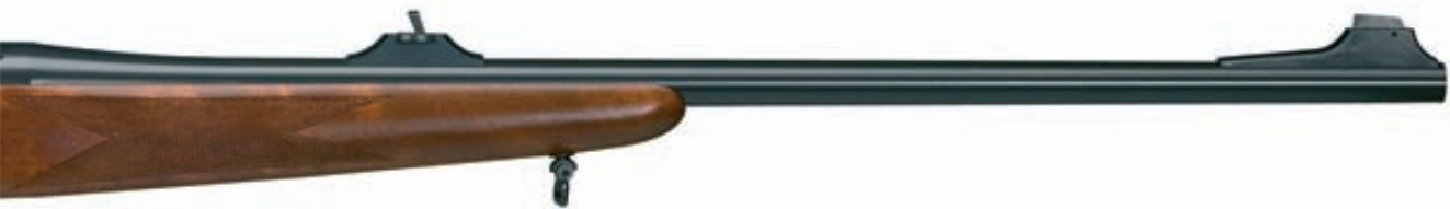
Один из «участников» охоты – карабин Merkel KR1