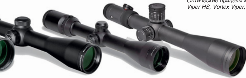
Оптические прицелы компании (слева направо): Vortex Viper PST, Vortex Viper HS, Vortex Viper, Vortex Diamondback, Vortex Crossfire, Vortex Razor HD