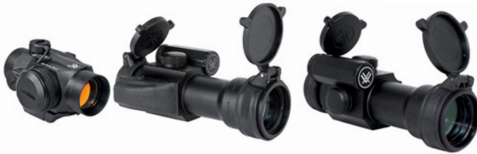
Модельный ряд коллиматорных прицелов Vortex (слева направо): StrikeFire SFBR-HUNT, StrikeFire SFBR-AR15, Sparc SPRC

Zero Stop, предотвращающая поворот барабанчиков прицепа более чем на один оборот от «ноля», позволяет избежать «потери ноля» при многочисленных вводах поправок. Прицельные сетки Vortex вытравлены на линзе (это не металлическая нить, как на большинстве прицелов других брендов). Для большей прочности и надёжности она размещена между двух слоёв стекла. Волоконно-оптический индикатор установленного увеличения MagView с метками, обращёнными к глазу стрелка, позволяет даже в сумерках определять выбранное увеличение без отрыва глаза от прицепа. Трёхслойное анодированное антибликовое покрытие корпуса обеспечивает высокую устойчивость к царапинам.