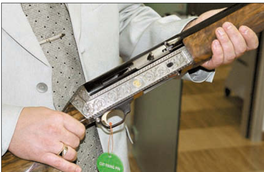
Юбилейное ружьё первой модели Benelli 121, хранящееся в заводском музее