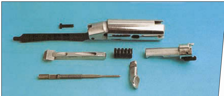
Детали инерционного затвора первой модели ружья Benelli 121

гаться по улице Рафаэля, мимо его дома под номером 57, легко можно очутиться на правой дорожной магистрале, часть которой носит имя Юрия Гагарина (!). Посетив улицу первого космонавта Земли, мы сворачиваем на юго-запад и оказываемся на улице Стационе (Via della Stazione), где под номером 50 располагаются строения всемирно известной оружейной компании Benelli Armi S.p.A.