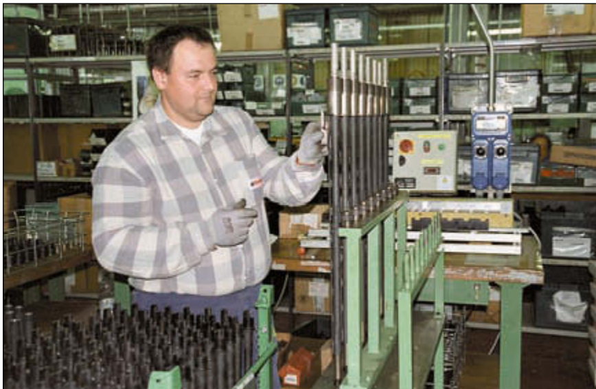
Одна из операций по сборке ружья Super Black Eagle

Мозг компании – инженерное подразделение, его люди и компьютерная техника последнего поколения. Лозунг, которому непрестанно следует руководство Benelli – «Всегда впереди!». Основная идея, пронизывающая всю деятельность конструкторов, технологов, мастеров и рабочих компании, всех 200 человек гласит: стараться делать в серии то, чего ещё нет на оружейном рынке. На Benelli считают, что даже когда какая-либо модель изготавливаемого оружия обладает превосходными качествами и пользуется неизменным спросом, это не означает, что её нельзя как-либо улучшить. Абсолютно совершенных вещей либо не существует в природе, либо они, в конце концов, приедаются. Возьмём, например, самозарядное охотничье ружьё с инерционным затвором. 36 лет компания Benelli постепенно, шаг за шагом шла вперёд,