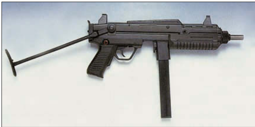
Пистолет-пулемёт под экспериментальный безгильзовый патрон Focsi 9 Auto. Это оружие – плод серьёзной научно-исследовательской работы, которая выходила за привычные рамки конструкторских разработок компании

Постоянный контроль за качеством производимых деталей ведёт метрологическая служба завода. Она оснащена новейшими измерительными приборами, среди которых установка Gamma 203, используемая для автоматического тестирования толщины и допусков на всех типах изделий. Измерительное оборудование оснащено взаимозаменяемыми головками, замена которых происходит автоматически в зависимости от тестируемого образца. Установка производит замеры и рассчитывает допуски, сравнивая эти значения с проектной документацией. В случае возникновения несоответствия установленным параметрам деталь бракуется, а на участке её изготовления отыскивается причина появления дефекта. По словам менеджера маркетинговой службы завода Франко Чернильяро, это случается крайне редко, и он не припоминает, когда это было в последний раз.