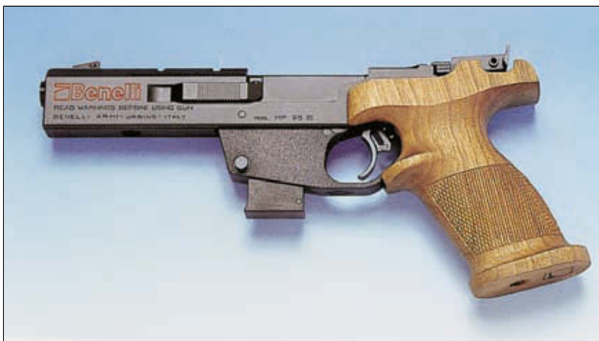
Спортивный пистолет MP-95E. Спортивное оружие Benelli широко используется стрелками многих стран мира