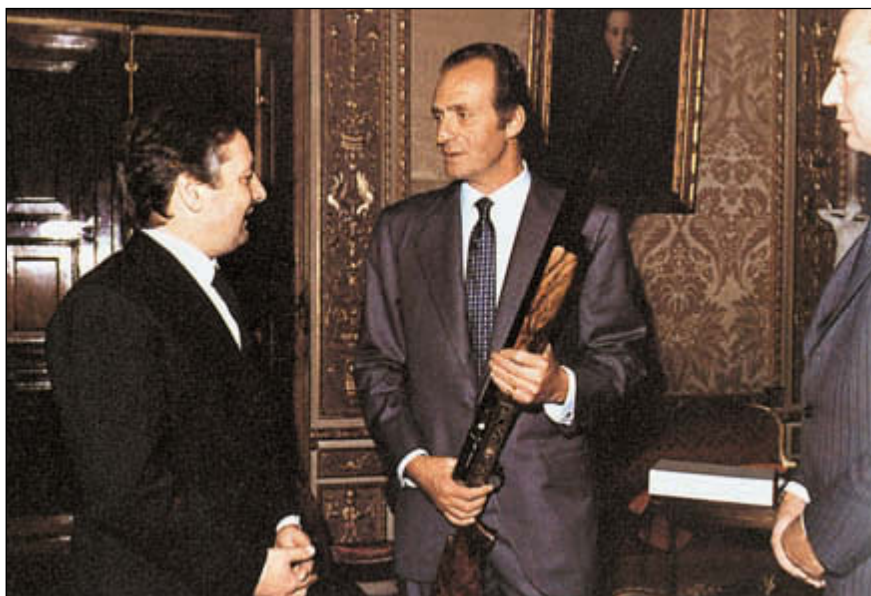
Паоло Бенелли вручает самозарядное ружьё Duca Federico di Montefeltro высокого уровня исполнения королю Испании Хуану Карлосу

для облегчения её обработки. Муфты стволов всех моделей производятся из высококачественной легированной закалённой стали (UNI 38 NCD 4), которая отличается превосходными механическими свойствами. Остов затвора («инерционное тело») изготавливается из стали высшего качества (UNI 16 N C 11), которая отличается как прочностью, так и эластичностью и подвергается поверхностному упрочнению. Для накопительной пружины затвора используется высококачественная сталь С98, обеспечивающая стабильность свойств пружины при 120 000 циклах.