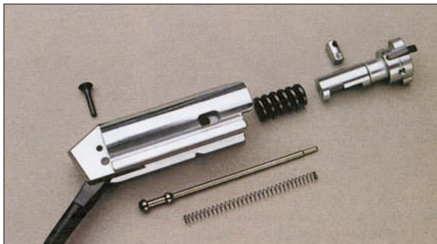
Детали затвора современного ружья Venelli. Затворы современных ружей Venelli имеют одинаковую конструкцию и отличаются друг от друга линейными и весовыми параметрами, а также характеристиками пружин

Несколько слов об экологическом режиме производства. При всей кажущейся вредности испарений из ванн с активными реагентами, воздух в помещении цеха чист и свеж. Собранные вентиляционными устройствами газы нейтрализуются, очищаются и только затем попадают наружу. Как выразился по этому по-