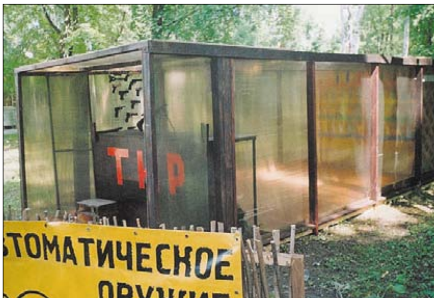
Один из вариантов устройства тирового модуля, который может использоваться, например, в больших помещениях. Стенки и крыша модуля собраны из листов поликарбоната