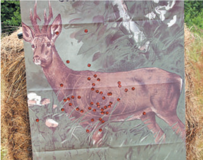
Так иногда на 300 м по «косуле» стреляла наша журналистская сборная Европы. Прямо скажем, не выдающиеся результаты... Правда, при сильном дожде и порывистом ветре