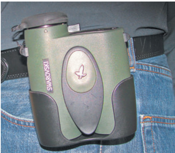
Бинокль Swarovski SLC 10x42 HD, который «на все 100» выручал меня на охотах в густых сумерках под проливным дождём

как сейчас и вышло, не будет пристрелян или даже опробован стрельбой лично самим охотником. Прошедшим вечером такой возможности у нас уже не было, и теперь приходится надеяться только на то, что особенности зрения и стрелковые привычки пристрельщика, проводившего выверку оптического прицела и пристрелку оружия, окажутся подходящими и для меня. В этом случае нужно стараться до минимума сократить дистанцию стрельбы и, прицеливаясь в середину лопатки, особенно тщательно отработать выстрел. И всё равно это чистая теория, практика же в этих непростых условиях может оказаться другой.