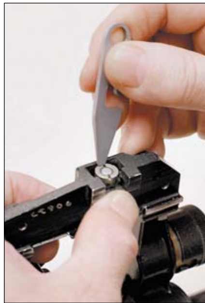
Регулировка узла крепления ПСО

7. Какова цена шкалы боковых поправок видимой в поле зрения ПСО?