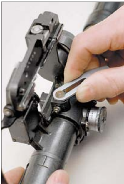
Затягивание лампочки подсветки сетки с помощью отвёртки

капсюлями. Это чревато инерционным наколом капсюля-воспламенителя и выстрелом при незапертом затворе с соответствующими последствиями для стрелка.