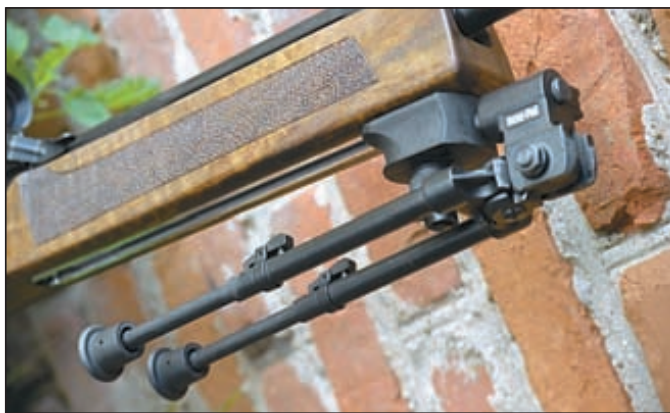
Расположение сошек на карабине может регулироваться, что бывает необходимо при стрельбе с различных позиций.

«Спорт» с сошками иностранного производства, которые при блестящем товарном виде оказались слабоватыми и вышли из строя при испытаниях в Вятских Полянах. Расположение сошек на карабине может изменяться, что бывает необходимо при стрельбе с различных позиций.