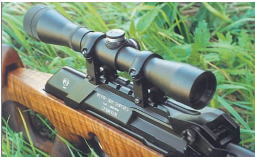
Поскольку «Вепрь-308 Супер Спорт» создан специально для высокоточной стрельбы, кронштейн для крепления оптического прицела доработан и имеет опорные поверхности в задней части