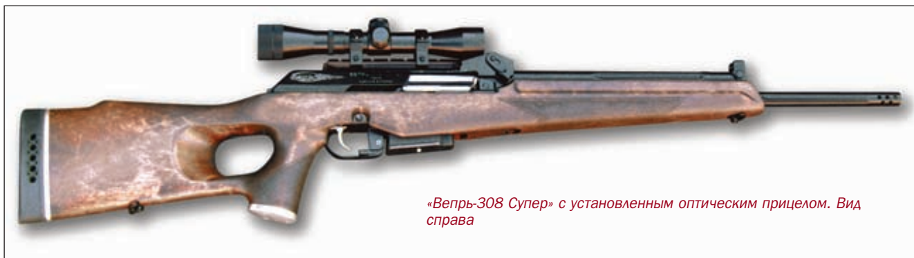
«Вебрь-308 Супер» с установленным оптическим прицелом. Вид справа

В первые в отечественной практике модификация системы Калашникова вместо приклада и цевья получила цельное ложе, в связи с чем исчез легко узнаваемый переводчик-предохранитель. Покупатель несомненно оценит современный дизайн ложи в сочетании с более высокими эргономическими показателями, позволяющими расширить диапазон «хватов» (приемов удержания оружия) и улучшить прикладистость оружия.