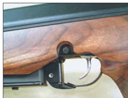
Кнопочный предохранитель, изменённая защёлка магазина, лёгкий пластмассовый магазин – лишь малая часть изменений, внесённых в конструкцию «Супера»

типа «ласточкин хвост» для крепления оптических прицелов, установленных на специальном кронштейне. Довольно массивный ствол по всей длине имеет продольные доли, существенно снижающие вес без изменения его жесткости, что определяет возможность ведения чрезвычайно точной стрельбы.