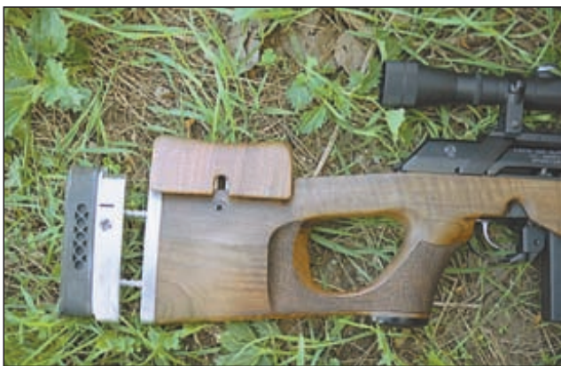
Приклад карабина регулируется по длине и может приспособиваться для стрельбы как с левой, так и с правой руки. Затыльник приклада перемещается в вертикальной плоскости