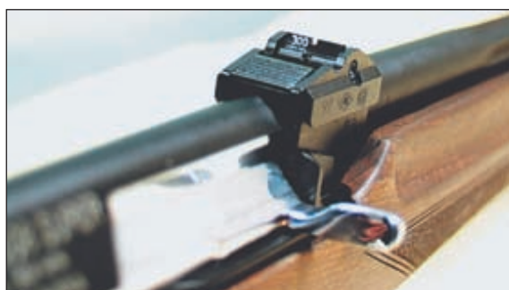
Целик карабина перекидной, двухпозиционный, рассчитан на дистанции 100 и 300 м