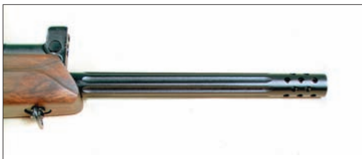
В передней части ствола имеются радиально-наклонные отверстия, которые выполняют функцию дульного компенсатора-пламегасителя

Не только для иностранцев предназначенается и новинка «Молота» – карабин «Вебрь-308 Супер Спорт».