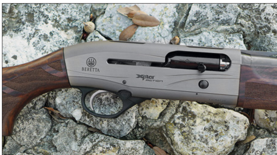
Новое ружье Action 20-го калибра – это ружьё, которое имеет хороший внешний вид, и его приятно носить

Эта новая модель Action 20-го калибра от «Беретты» расширяет платформу самозарядных ружей компании в сторону малого калибра.