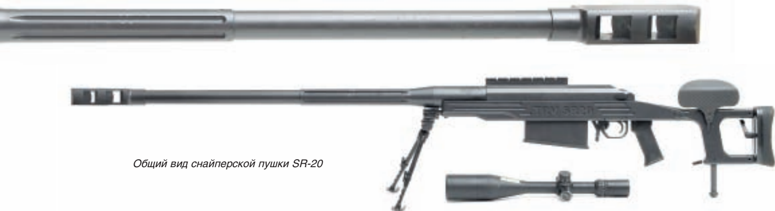
Общий вид снайперской пушки SR-20

разработана южно-африканской фирмой Truvelo Manufactures и предназначена для поражения легкобронированных подвижных средств, коммуникаций и систем управления.