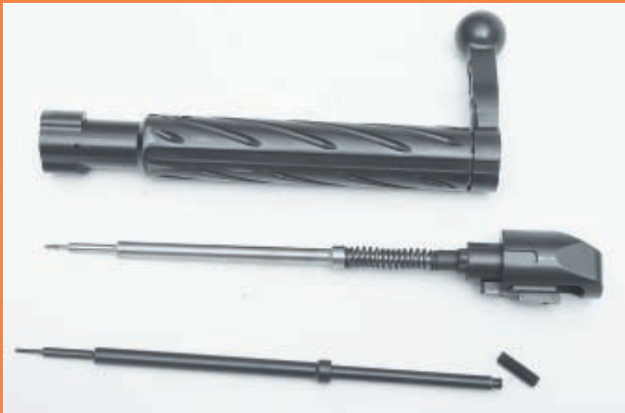
Для облегчения затвор SR-20 имеет отверстия в рукоятке и глубокие винтовые долы на стебле, которые также служат для сбора пыли с целью исключения затирания при повороте затвора. Интересно, что при демонстрационной стрельбе из новой винтовки ударник «прожил» всего 5 выстрелов