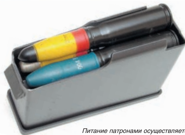
Питание патронами осуществляется из отъёмного коробчатого магазина с двухрядным расположением патронов

Для стрельбы из SR-20 используются боеприпасы от немецкой авиационной пушки MG 151 времён второй мировой войны