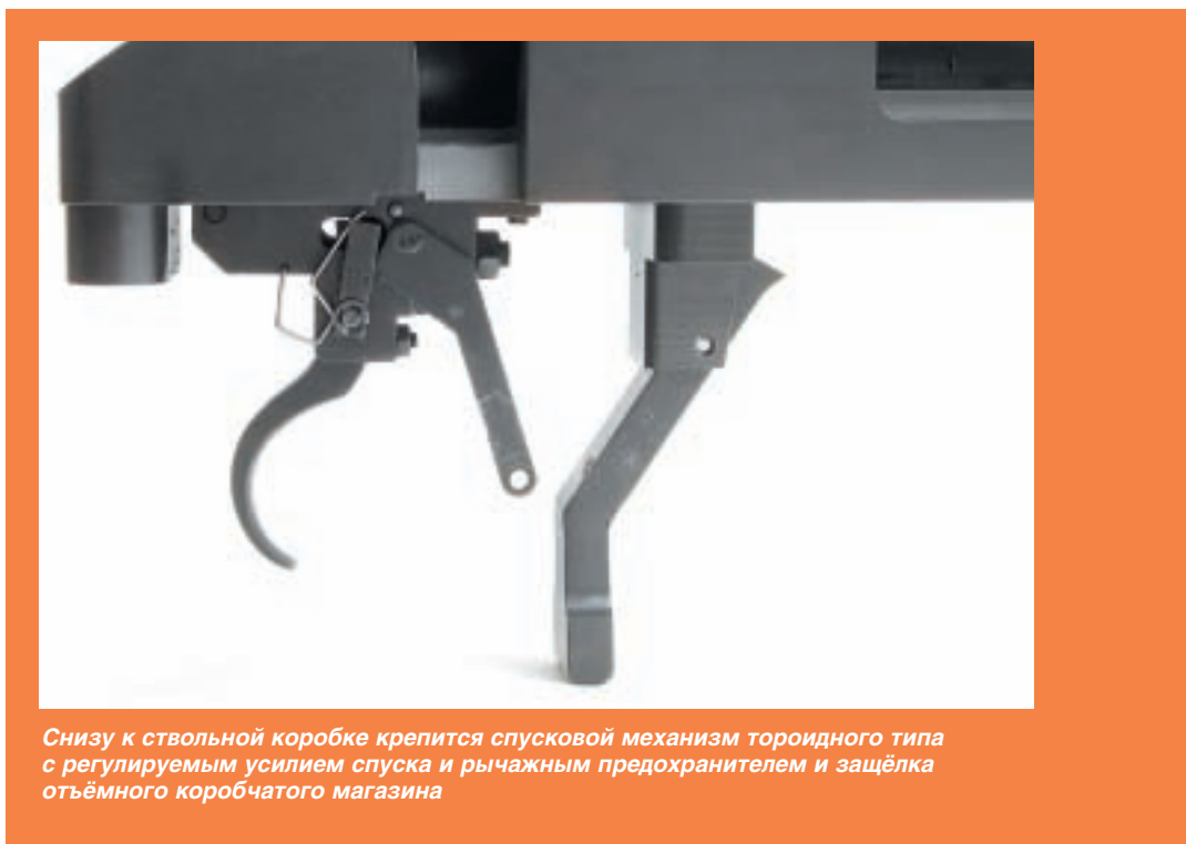
Снизу к ствольной коробке крепится спусковой механизм тороидного типа с регулируемым усилием спуска и рычажным предохранителем и защёлка отъёмного коробчатого магазина

Приклад изготовлен из авиационного алюминия марки 7075 (EN или AA). Длина приклада составляет 170 мм. К тыльной стороне приклада крепится выдвижной плечевой амортизатор с регулировкой в пределах 60 мм, который имеет резиновый буфер с воздушной подушкой для поглощения остаточной энергии отдачи. Эта часть приклада может перемещаться по высоте в пределах \pm 40 мм, что позволяет конкретному стрелку найти наиболее удобную точку приложения приклада к плечу. Фиксация нужного положения осуществляется специальным флажковым фиксатором.