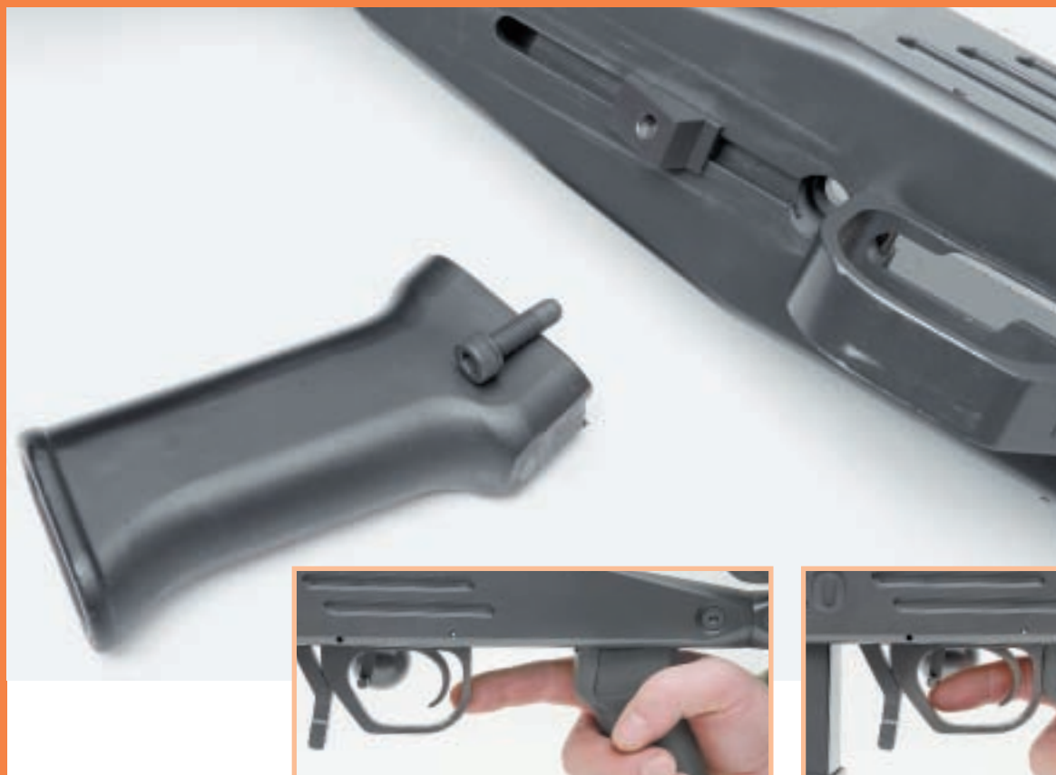
Пистолетная рукоятка крепится к ложе винтом и фасонной гайкой и имеет возможность продольной регулировки

Сошки имеют ступенчатую регулировку высоты линии огня. Все крепёжные винты оружия имеют современную прогрессивную головку под шестигранный ключ, что обеспечивает их более плотную и равномерную протяжку и повышенный срок службы. Все поверхности оружия окрашены ровным слоем матовой серо-чёрной краски, что в сочетании с тщательной обработкой деталей и прекрасного качества литьём придаёт оружию привлекательный вид. Вместе с тем, при внимательном осмотре обнаружены очевидные следы производственного брака, что,