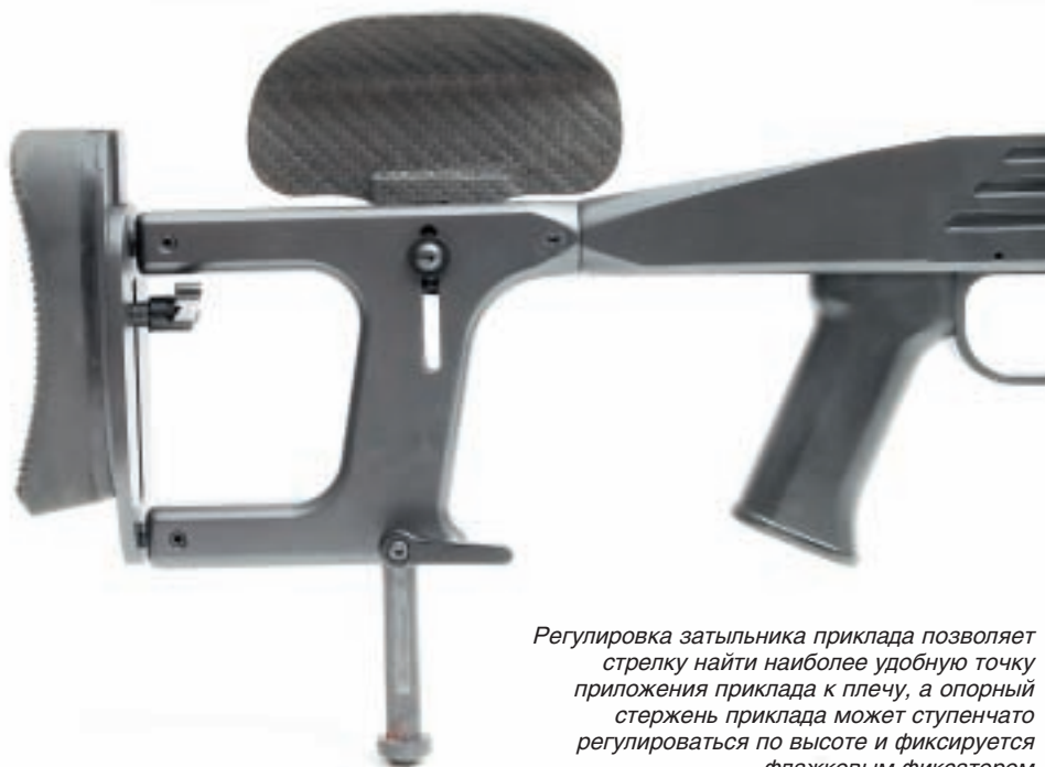
Регулировка затыльника приклада позволяет стрелку найти наиболее удобную точку приложения приклада к плечу, а опорный стержень приклада может ступенчато регулироваться по высоте и фиксируется флажковым фиксатором

с оптическим прицелом хода регулировки по вертикали не хватает, а механического прицела конструкцией не предусмотрено.